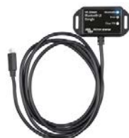
VE.Direct Bluetooth Smart Dongle (separat zu bestellen)

Eine zu hohe oder zu schwache Batteriespannung wird durch einen akustischen und einen visuellen Alarm sowie durch ein Relais für eine Fernanzeige signalisiert.