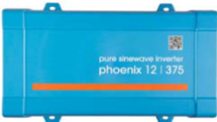
Phoenix 12/375 VE.Direct

250VA – 1200VA 230V und 120V, 50Hz oder 60Hz