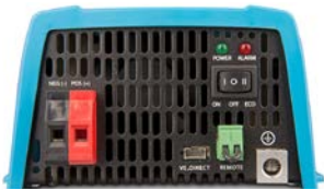
Phoenix 12/375 VE.Direct